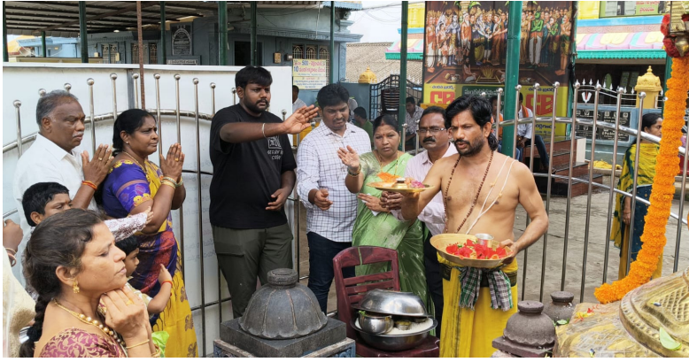
జంగారెడ్డిగూడెం:జూన్ 27(ప్రజా వీక్షణం)