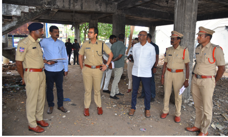
నిర్మాణ పనులకు పోలీస్ కమిషనర్ అధికారులతో చర్చించారు.

మహిళా పోలీస్ స్టేషన్ చేరు కోవడంతో పాటు, పబ్లిక్ రవాణా సౌకర్యాలు సౌలభ్యం వుండే విధంగా సూతనంగా ఏర్పాటు మహిళా పోలీస్ స్టేషన్ కు అవరణ మౌళిక పనులు లతో పాటు, ఇదే స్టేషన్ నందు సూతనంగా ఏర్పాటు చేయనున్న ఫ్యామిలీ కౌన్సిలింగ్ కేంద్రానికి అవరణ పూర్వ ఇక్కడి వచ్చే వారికి వాహన పార్కింగ్ లాంటి మొదలైన అంశాలు దృష్టిలో వుంచుకొని పోలీస్ కమిషనర్ ని సంబంధిత పోలీస్ అధికారులతో క్షేత్ర స్థాయిలో స్థల పరిశీలన నిర్వహించడంతో పాటు,