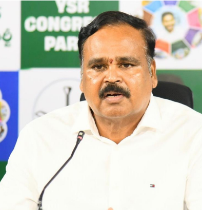
పోలీసు శాఖను డిమాండ్ చేస్తున్నామన్నారు. రైతుల హక్కుల పరిరక్షణ కోసం వైఎస్సార్ సీపీ ఎల్లప్పుడూ అండగా ఉంటుందని, ఎన్ని దాడులు, బెదిరింపులు చేసినా రైతుల పక్షాన మా పోరాటం ఆగదని వివరించారు.

భూములు ఇవ్వడానికి నిరాకరించిన రైతులను బెదిరించడం, వేధించడం, వారి భూముల చుట్టూ మట్టి తవ్వేసి వ్యవసాయం చేయకుండా అడ్డు కొవడం అత్యంత అమానుషమని ఆగ్రహం వ్యక్తంచేశారు. వైఎస్సార్ సీపీ బృందంపైనే దాడి జరగడం వెనుక ప్రభుత్వ కుట్ర స్పష్టంగా కనిపిస్తోందని తెలిపారు. ప్రజల సమస్యలను ప్రస్తావిం చే ప్రతిపక్షాన్ని అణచివేయాలనే ధోరణిని ప్రజలు ఎప్పుడీ అంగీ కరించదని చెప్పారు. అధికార పార్టీకి చెందిన కొందరు నాయకులు గూండాలను ప్రోత్సహిస్తూ ప్రజా స్వామ్యాన్ని అపహాస్యం చేస్తున్నారని మండిపడ్డారు. దాడికి పాల్పడిన టీడీపీ కార్యకర్తలు, కుట్రదారులను వెంటనే గుర్తించి వారిపై కఠిన చర్యలు తీసుకోవాలని