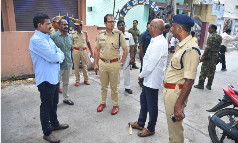
ఉమ్మడి వరంగల్ జిల్లా స్టాప్ లిపోర్టర్ జూన్ 27 (ప్రజా వీక్షణం న్యూస్)